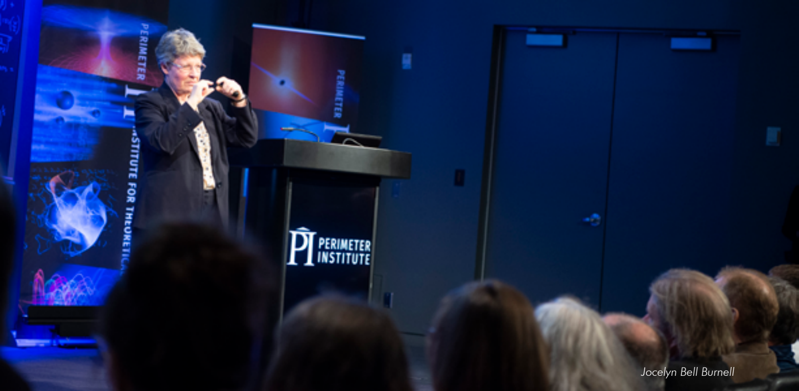
Jocelyn Bell Burnell