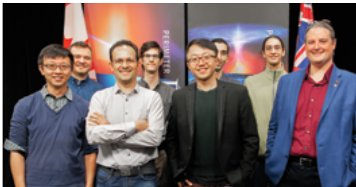
L'initiative EHT de l'Institut Périmètre